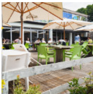
À l'arrivée des kayaks

DIRECTEMENT DANS NOS HÉBERGEMENTS (P. 11) OU DANS NOS ESPACES AMÉNAGÉS (À L'ISSUE D'UNE ACTIVITÉ), RETROUVEZ-VOUS AUTOUR D'UN DÉLICIEUX REPAS.